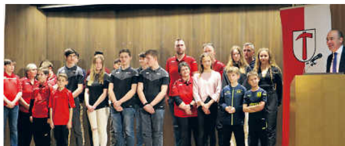
Einzel-sportlerinnen und -sportler auf der Bühne im ev. Gemeindehaus