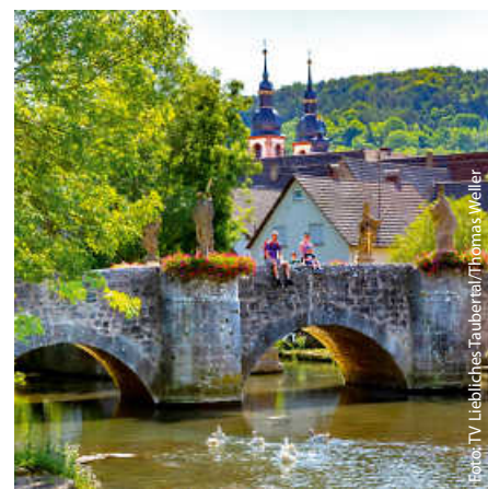
Die Grünbachbrücke in Lauda-Königshofen.