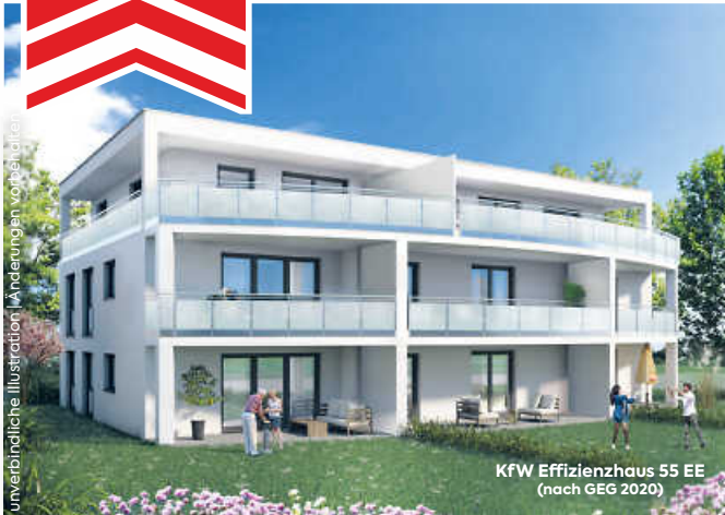
KfW Effizienzhaus 55 EE (nach GEG 2020)