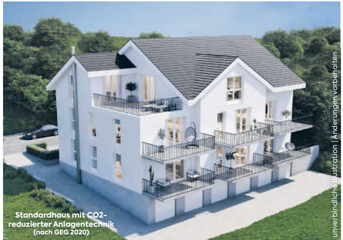
Standardhaus mit CO2-reduzierter Anlagentechnik (nach GEG 2020)

Leben in der Großen Kreisstadt Öhringen: Moderne 3½-Zimmer-Eigentumswohnungen mit Terrasse oder Balkon, Tageslichtbad, elektrischen Rollläden, Aufzug, BHKW, Fußbodenheizung, Tiefgarage sowie Außenabstellplätze u.v.m.! Innenausbau begonnen.