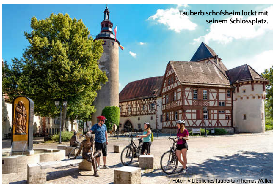
Tauberbischofsheim lockt mit seinem Schlossplatz.

Zahlreiche Freibäder, der Kletterpark in Wertheim sowie der Tierpark Bad Mergentheim bieten vor allem Familien tagesfüllende Ausflugsziele oder lohnende Zwischenstopps an. Die Zeit für kulinarische Pausen kommt dabei nicht zu kurz: nach einem Grünkerngericht als Vorspeise bieten sich Tauberforellen oder ein Taubertäler Lamm an. Neben Weinliebhabern macht das Taubertal auch Freunde des Bieres glücklich; gleich vier Brauereien verteilen sich auf den hundert Kilometern Strecke. Na dann, zum Wohl! (tam)