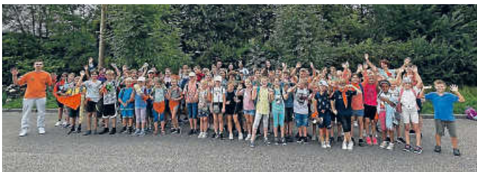
Die Kinder der Gemeinden Bretzfeld und Neuenstein gemeinsam beim Kinderferienprogramm der RBHL.

Mit den Gemeinden Bretzfeld und Neuenstein organisiert die Raiffeisenbank bereits seit vielen Jahren im Rahmen des Kinderferienprogramms einen Ausflug zum Erlebnispark Tripsdrill. Seit diesem Jahr hat die Raiba nun auch die Gemeinden Künzelsau, Niedermhall, Weißbach, Mulfingen, Dörzbach und Schöntal dieser schönen Tradition angeschlossen. So ging es am 17. und 24. August gemeinsam mit Betreuern der Raiffeisenbank und der Gemeinden, für mehr als 220 Kindern aus dem Hohenloher Land nach Tripsdrill. Bei strahlendem Sonnenschein, guter Laune und einem unvergesslichen Tag steigt die Freude für das kommende Jahr um so mehr.