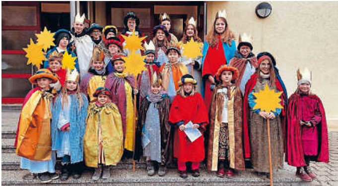
Sternsänger von Christus König Neuenstein