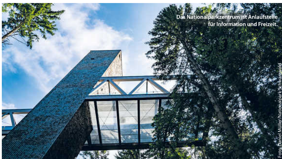
Das Nationalparkzentrum ist Anlaufstelle für Information und Freizeit.

Alles in allem ein echter Grund zum Feiern! „Über das gesamte Jahr wollen wir Bürgerinnen und Bürger bei Führungen und Veranstaltungen dazu einladen, den Nationalpark vor Ort und gemeinsam mit uns zu erleben. Wir wollen genau hinschauen, auf die großen und kleinen, die sichtbaren und verborgenen Veränderungen“, sagt Schlund voll Vorfreude auf ein volles Programm zum Jubiläumsjahr. (pm/red)