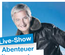
Live-Show Abenteuer Weltumrundung