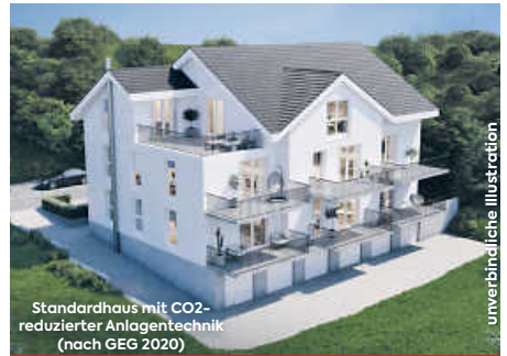
Standardhaus mit CO2-reduzierter Anlagentechnik (nach GEG 2020)

Attraktive 2½, 3½- & 4½-Zimmer-Eigentumswohnungen in naturnaher Lage im Waldfeld mit Balkon, Tageslichtbad, Fußbodenheizung, Aufzug, Tiefgarage, Außenabstellplätze und viele weitere Extras! Innenausbau begonnen.