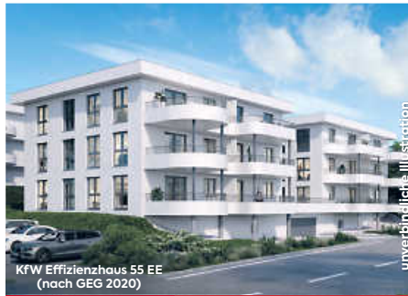
KfW Effizienzhaus 55 EE (nach GEG 2020)

Wohnen für Junioren & Senioren: Moderne 3½-Zimmer-Eigentumswohnungen mit Terrasse im Mannlehenfeld II, auf Wunsch mit Seniorenbetreuung durch die AWO , kurzfristig beziehbar, Tiefgarage, Außenabstellplätze & vieles mehr!