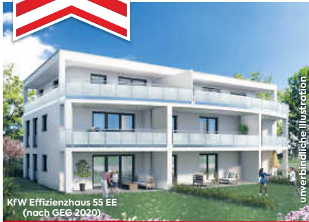
KfW Effizienzhaus 55 EE (nach GEG 2020)