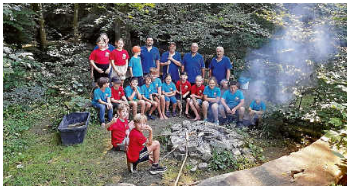
Gruppenfoto am Lagerfeuer

Ein lustiger und abwechslungsreicher Tag für alle Beteiligten.