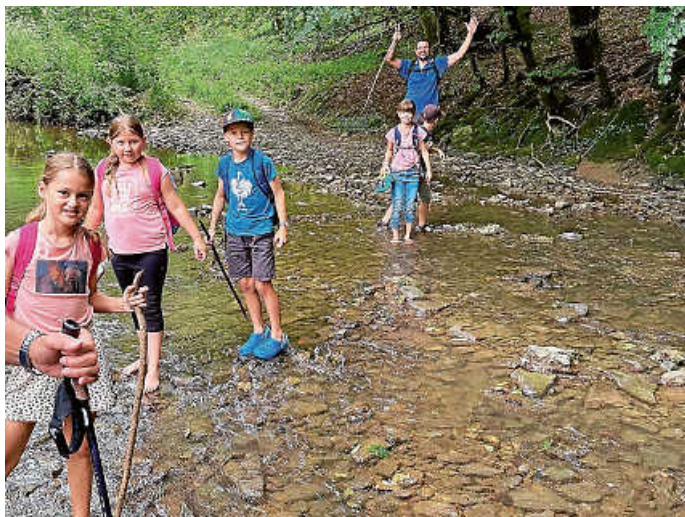
Mitten durch die Kupfer