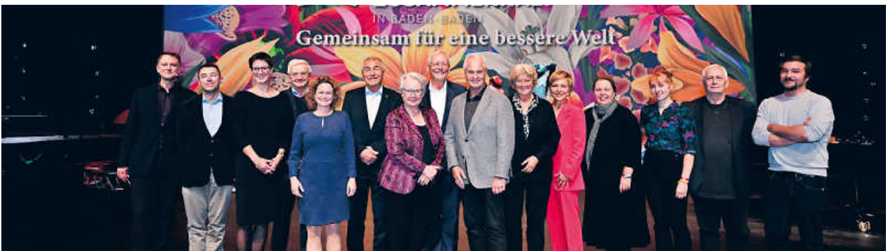
Impressionen vom Forum für Gesellschaftlichen Zusammenhalt 2022 in Baden-Baden.

Buchen Sie jetzt Ihre kostenlosen Tickets!