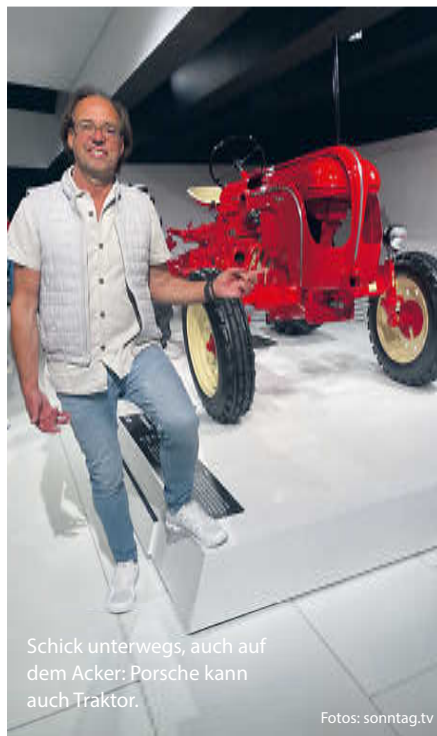
Schick unterwegs, auch auf dem Acker: Porsche kann auch Traktor.